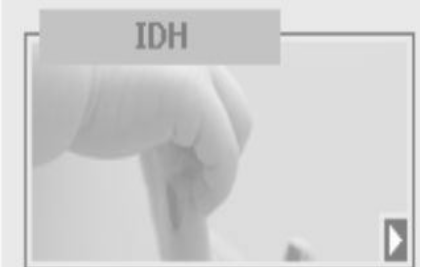
Crescimento Bruto de IDH

16/09/2009 Audiência Pública do CVT levou dezenas de pessoas à Câmara Municipal