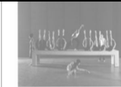
Cia de dança Deborah Colker se apresenta em Barra do Piraí