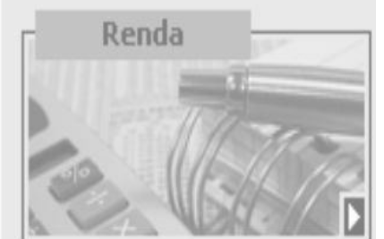
Renda per capita